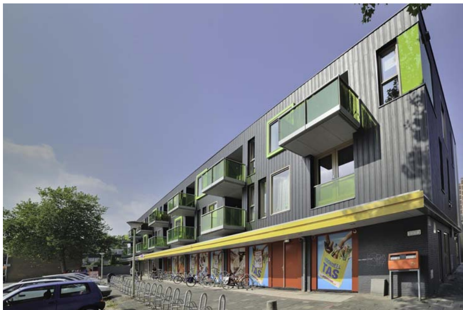
De Bloemkorf en de Vomar-supermarkt.