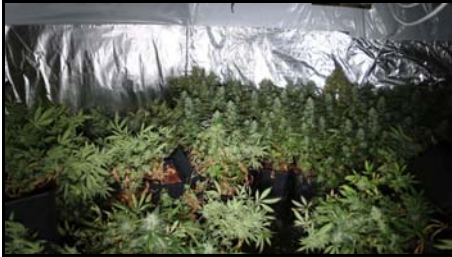
Indoor wietteelt.

In de Abraham Kloosstraat wordt op 24 januari 2016 een plantage met 165 planten ontdekt. Twee Amsterdammers worden aangehouden.