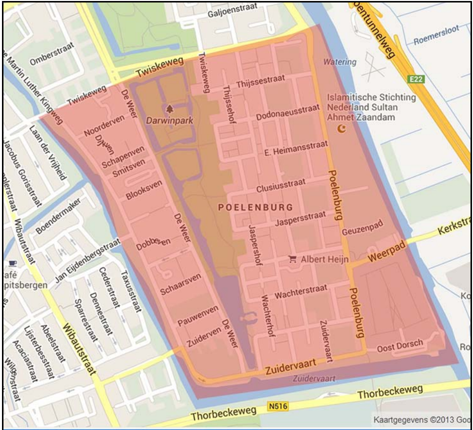
De Zaandamse wijk Poelenburg.