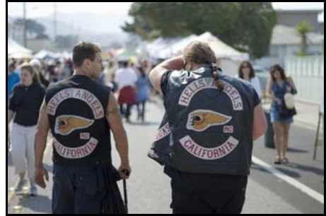
Hells Angels.

Volgens wijkagenten in den lande heeft de georganiseerde misdaad vrij spel als gevolg van een tekort aan rechercheurs 10 .