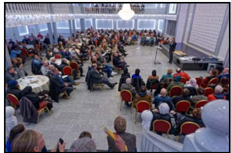
Bewonersavond APP.

Ondanks menig amendement en wellicht mede door het inspreken van de KBG, overleeft het plan de gemeenteraadsvergadering van 17 november 2016, zodat op 29 november een bewonersavond kan worden georganiseerd. Die verheugt zich dankzij een voor Zaanse begrippen ongekende reclamecampagne en de verstrekking van voedsel aan het begin van de bijeenkomst in een grote opkomst.